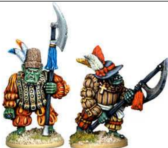
LAUGHING GRIMRUNG THE UPROARIOUS & LUCKY TODDER SNOTHAGUN