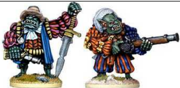
GNOTHAGAM THE PROUD & RED BALLADRIN THE NAILIER