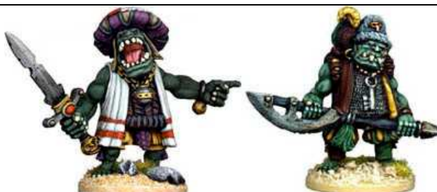
GASHONOCK THE RETIRING & GNARLY TONGAROTH