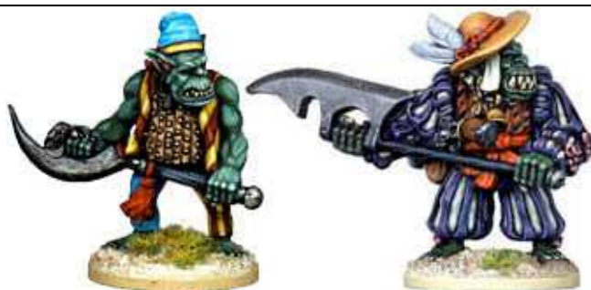
LONELY TARROGOTH & SNUDDANETH NOSEBITER