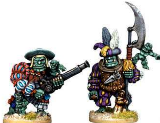
DEADEYE DROGGALOTH & SKELTER HOGGARETH