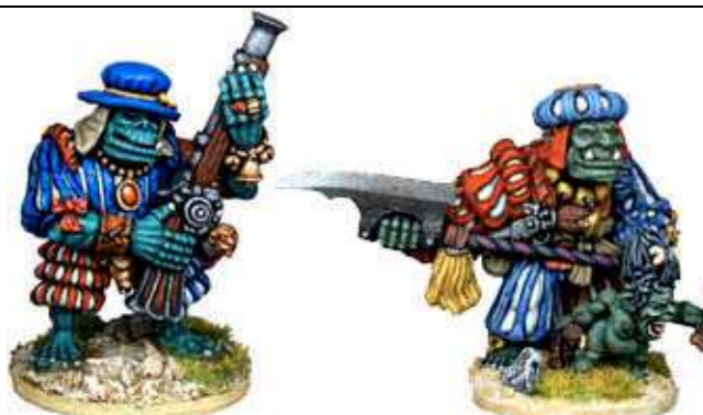
DOGGO GARRAKON & TARRATHOG THE OBLIVIOUS