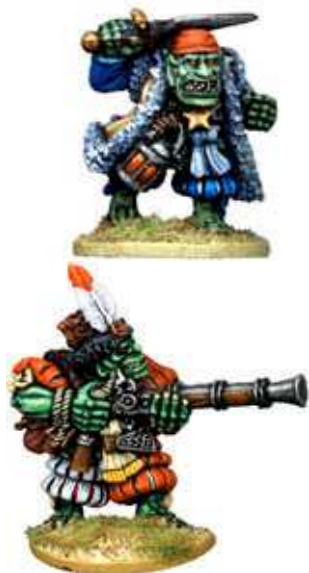
War Orcs: blister da 4 random