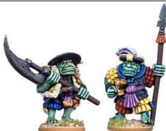
War Orcs: blister da 4 random