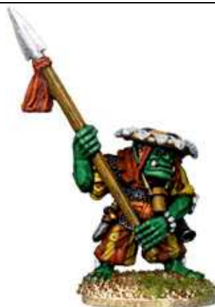
War Orcs: blister da 4 random