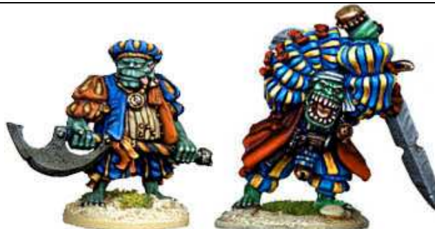
SLIPPERY JONADDON & BIG DAFT BALLAGUTHON