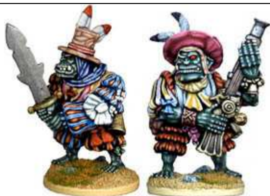
SCRATCHARSE CURROCKETH & SNOTTY WINKLE BALLUNETH