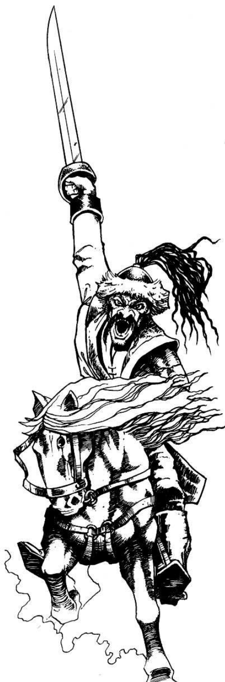
Immagine tratta dal FANTASY WARRIORS COMPANION by NICK LUND