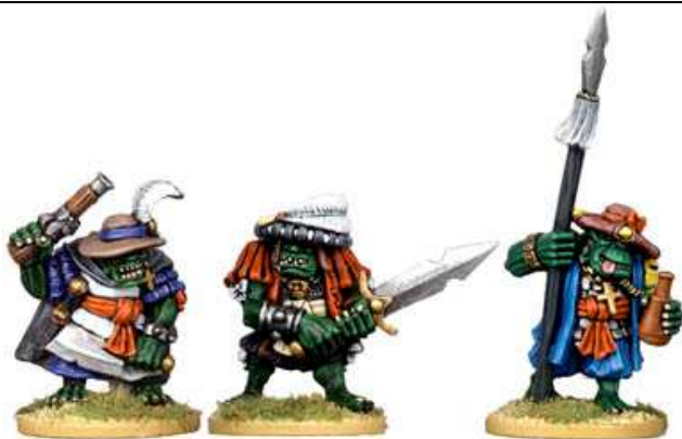
War Orcs: blister da 4 random