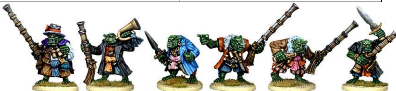
War Orcs: blister da 4 random